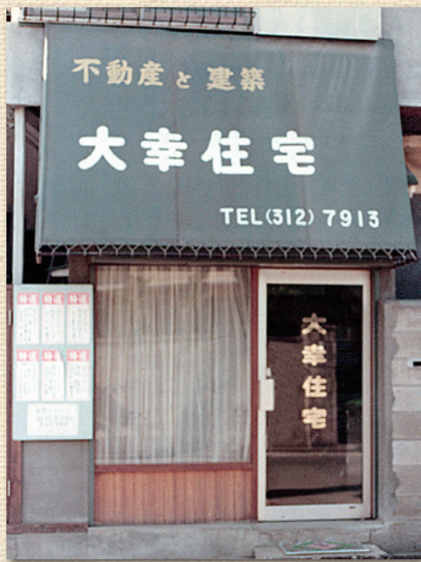
高円寺に開業時の大幸住宅