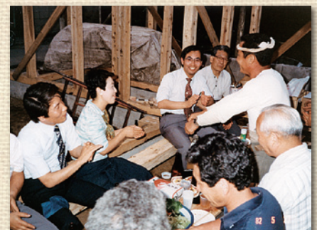
松ノ木の自宅を建築、上棟式にて