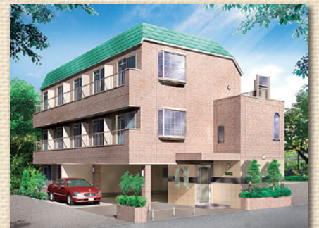
サットンプレイス・新高円寺

大幸住宅株式会社 免許更新 宅地建物取引業 東京都知事免許(12)第15384号