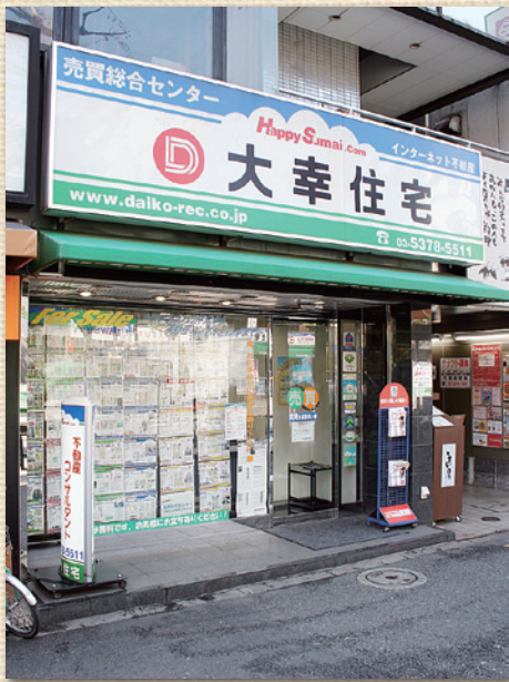
売買総合センター