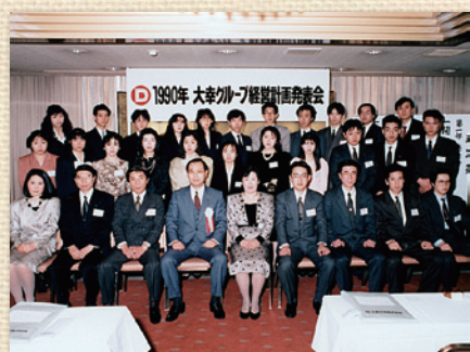
第1回 経営計画発表会

大幸ホーム株式会社 免許更新 宅地建物取引業 東京都知事免許(2)第56384号