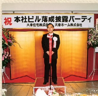
本社ビル落成披露パーティー