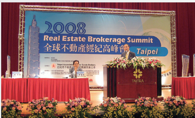
パネルディスカッションの様様