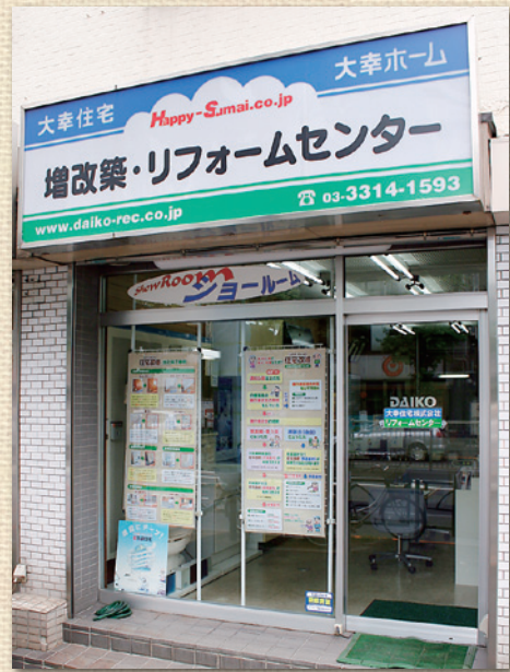
増改築・リフォームセンター