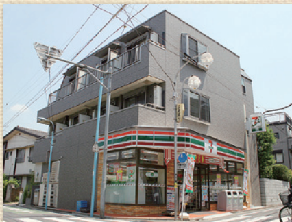
サットンプレイス・S松ノ木