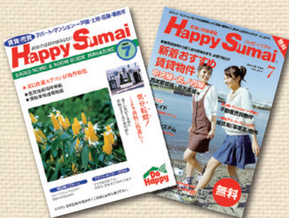
Happy Sumai (ハッピースマイ)

5月 大幸ホーム株式会社 免許更新 宅地建物取引業 東京都知事免許(4)第56384号 大幸グループのホームページを開設 11月 不動産月刊情報誌「Happy Sumai」DTPによる編集開始