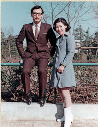
創業当時の二人(高円寺中央公園)