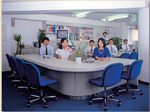
当時の新宿支店 店内