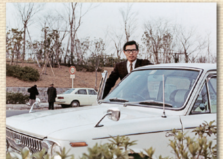
初の社用車となるカローラ