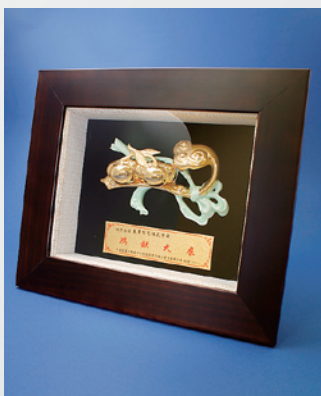
来社記念に頂いた置物

平成20年2月21日(木)、台湾の不動産業者団体「中華民國不動産仲介經紀商業同業公會全國聯合會」の皆様が来日。日本の不動産業者の視察で、当社を訪問されました。賃貸管理業務など、まだ台湾では一般的でない不動産業務もあるそうで、大変熱心に質問する姿が印象的でした。