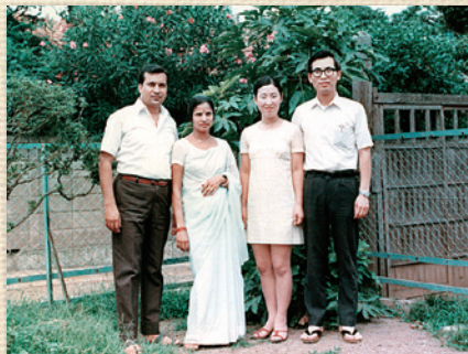
当時のお客様(東京大学のインド人留学生)と