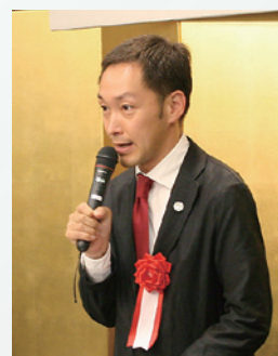
早坂義弘 東京都議会議員 挨拶