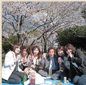
善福寺川公園にてお花見

5月 大幸ホーム株式会社 免許更新 宅地建物取引業 東京都知事免許(6)第56384号