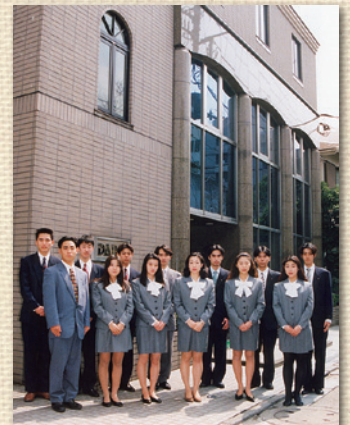
平成7年度 新入社員