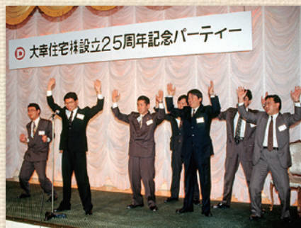
大幸住宅(株)設立25周年記念パーティー