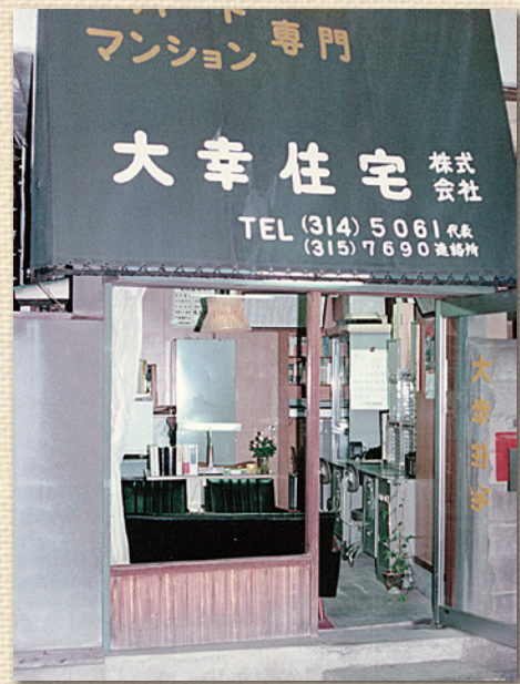
大幸住宅株式会社(※1978年4月閉鎖)