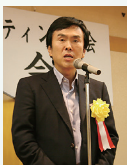
石原伸晃 衆議院議員 挨拶