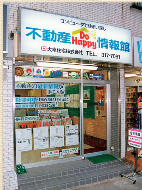
不動産情報館・売買総合センター（※現・リフォームセンター）