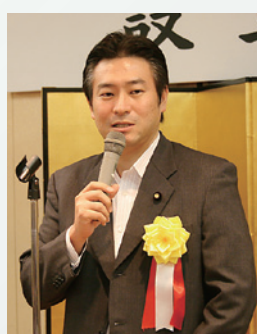
秋元司 参議院議員 挨拶