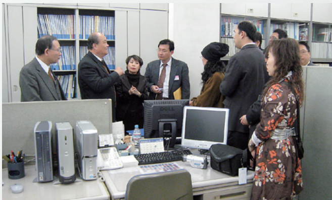
当社の管理部を見学される視察団の皆様