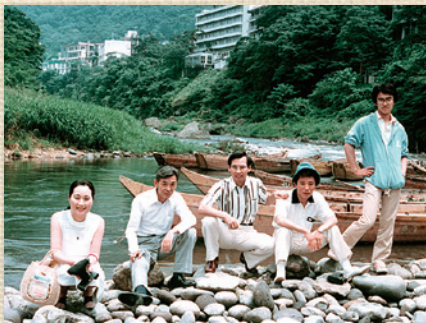
初めての社員旅行

東京都杉並区高円寺南2丁目20番1号に 「住宅総合センター」を開設 大幸住宅株式会社 資本金1,600万円に増資