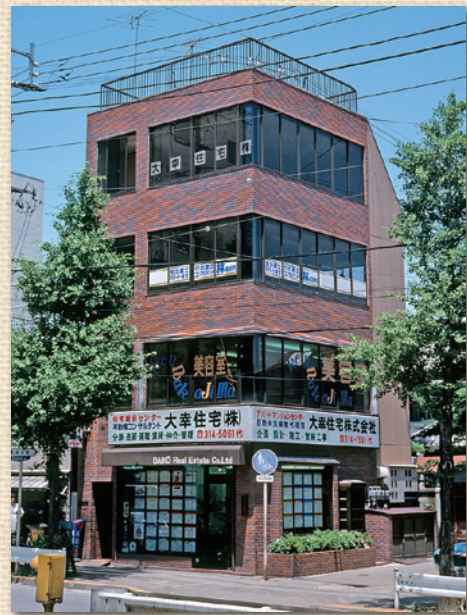
住宅総合センター（※現・賃貸総合センター）