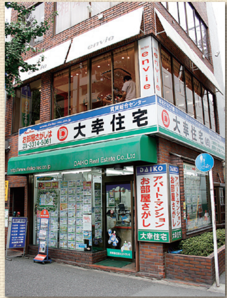
賃貸総合センター