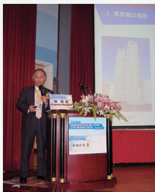
東京の不動産マーケットの現状 について講演しました