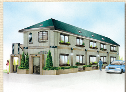
サットンプレイス・Y2