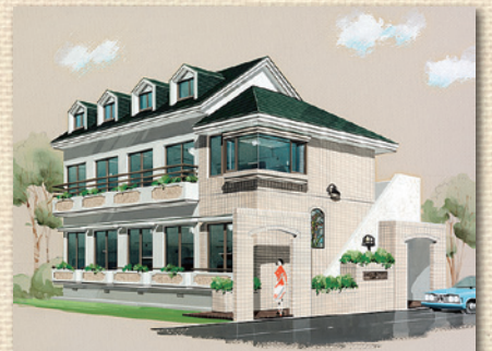
サットンプレイス・高円寺