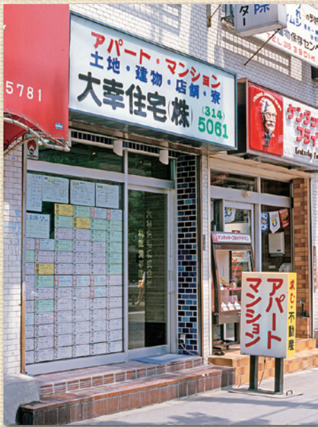
アパート・マンション賃貸センター（※現・リフォームセンター）