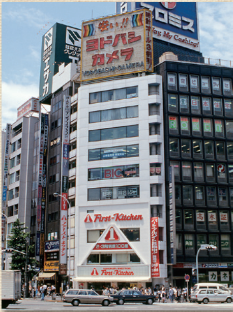
新宿支店（※写真中央のビルの7階）