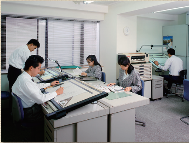
当時の大幸ホーム株式会社 (大幸本社ビル2階)