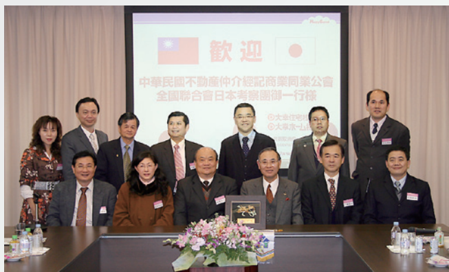
視察団の皆様と記念撮影