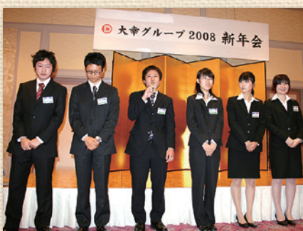
新年会 (平成20年度 新入社員)